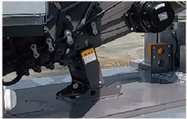
봄 자동 격납 시스템(자동 원점 복귀 시스템)