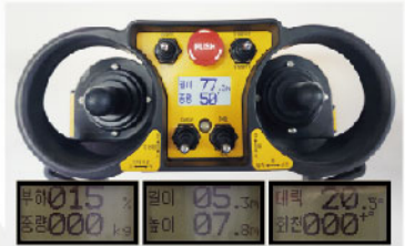
4K LCD리모컨 적용으로 제원 확인하면서 작업가능