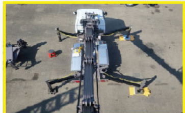
조수석 방향 작업범위 향상